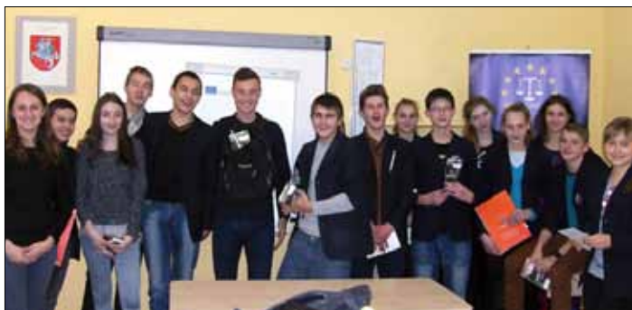
Podczas warsztatów uczniowie zapoznali się z podstawowymi prawami człowieka, międzynarodowymi przepisami