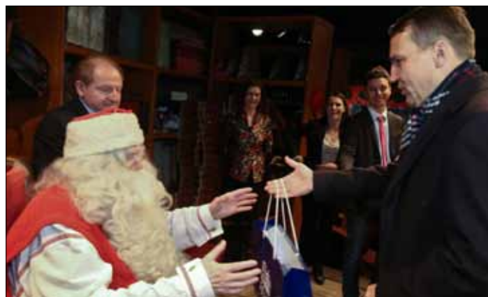
Marszałek Polski Sejm Radosław Sikorski przebywający z wizytą w Finlandii odwiedził m. in wioskę św. Mikołaja