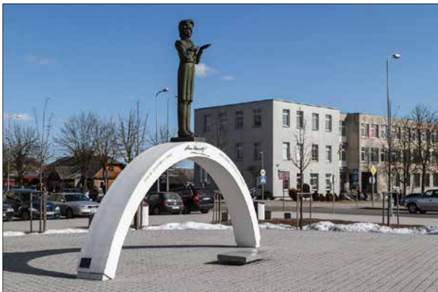
■ Sąd kazał usunąć tablice z polskimi napisami w Solecznikach

Wileński Okręgowy Sąd Administracyjny przychylił się do decyzji Państwowej Inspekcji Językowej w sprawie usunięcia napisów w języku polskim na terenie Solecznik.