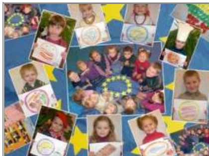
Jedna z prac konkursowych

Dobiega końca konkurs organizowany przez Europejską Fundację Praw Człowieka „Europa na co dzień”. Konkurs wywołał ogromne zainteresowanie młodzieży, szczególnie uczniów klas początkowych, a do EFPC napłynęło ponad 120 prac ze szkół Wilna, rejonu wileńskiego i sołecznickiego.