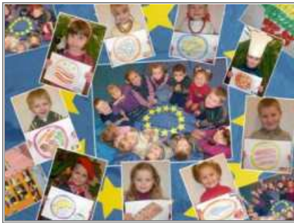
Jedna z prac konkursowych

Dobiega końca konkurs organizowany przez Europejską Fundację Praw Człowieka „Europa na co dzień”. Konkurs wywołał ogromne zainteresowanie młodzieży, szczególnie uczniów klas początkowych, a do EFPC napłynęło ponad 120 prac ze szkół Wilna, rejonu wileńskiego i sołecznickiego.