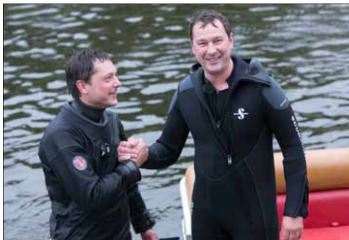
Obok Białego Mostu mer Wilna Artūras Zuokas dał nura, aby sprawdzić zanieczyszczenie wody i dna rzeki