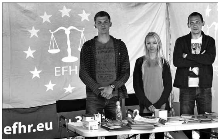
Przy stoisku można było znaleźć bezpłatne materiały informacyjne