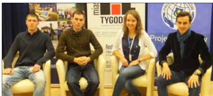
Delegacja z Wilna podczas Central Youth Forum w Tarnowie uczestniczyła w wielu ciekawych spotkaniach