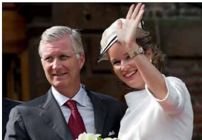
Król Filip i królowa Matylda pozdrawiają mieszkańców Wavre (Walonia-Brabant w Belgii)