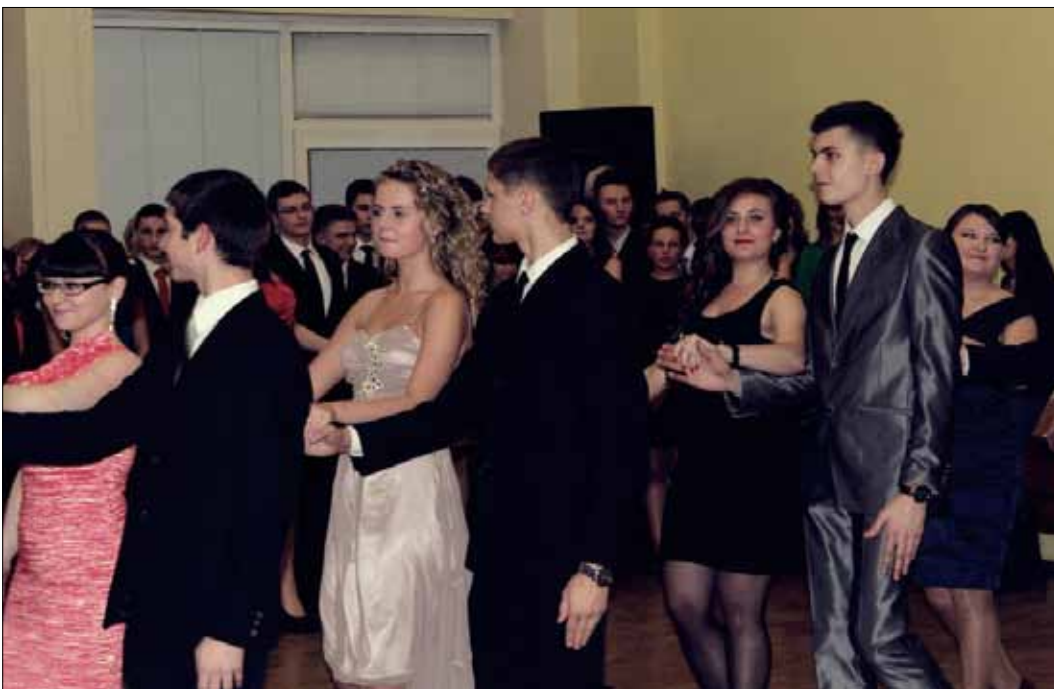
Tradycyjny polonez w wykonaniu maturzystów gimnazjum im. Adama Mickiewicza

W polskich szkołach na Litwie tradycyjnie na początku lutego odbywają się studniówki i spotkania absolwentów. Mniejsze szkoły organizują to jako jedno spotkanie, inne natomiast organizują dwie oddzielne imprezy.