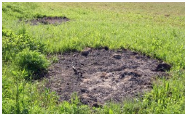
Spalona ziemia — symboliczny i wymowny znak samowoli „nowych” farmerów na ziemi miejscowych Polaków