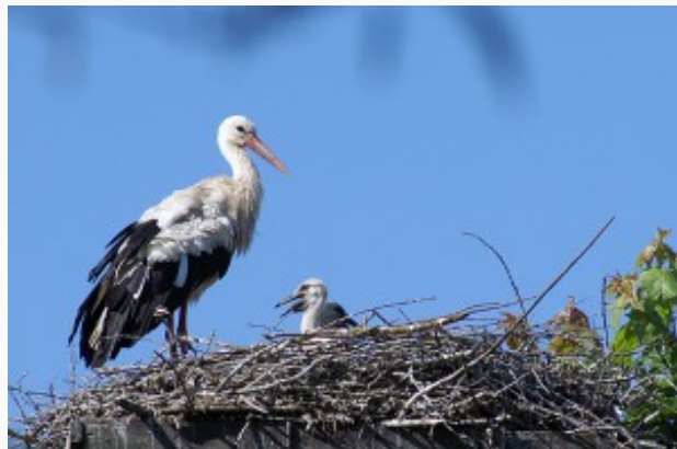
Bociany, jak i miejscowi ludzie, korzeniami wciąż tkwią na ziemi swoich przodków

W regionie leżącym przy szczelnie strzeżonej granicy z Białorusią, nieskażona ziemia jest bowiem ich największym bogactwem. Pracy tu nie ma żadnej. Najbliższe zatrudnienie można znaleźć 50 km stąd w Wilnie. Ale