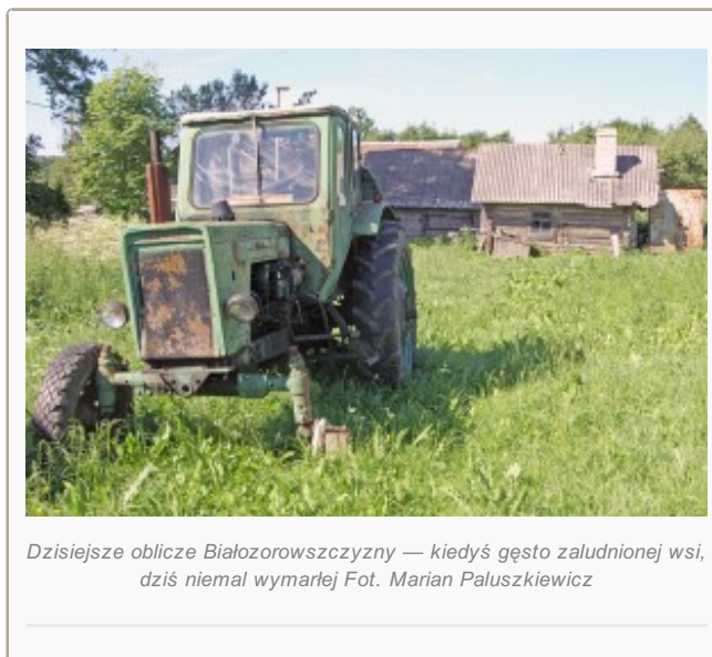
Dzisiejsze oblicze Białozorowszczyzny — kiedyś gęsto zaludnionej wsi, dziś niemal wymarłej