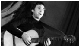
Twórczość Wysockiego w Wilnie