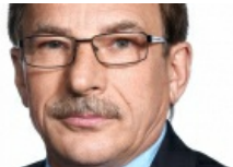
Raczkowski: Każdego roku emigracja na Litwę przysyła 4 mld litów