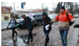
Gra miejska na rzecz WOŚP