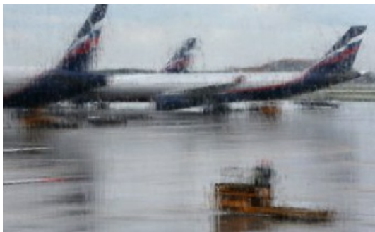
Skandal! Rosyjscy piloci latali na fałszywych licencjach