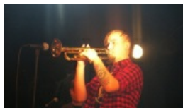
W DKP gwiazdy na rzecz WOŚP