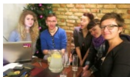
Odbyła się „Bitwa mózgow” na rzecz WOŚP