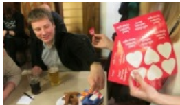
Do 11 tys. wzrosła suma pieniędzy zebranych podczas wileńskiej WOŚP