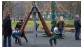
W ciągu dwóch dni do przedszkoli zarejestrowano prawie 80 proc. dzieci