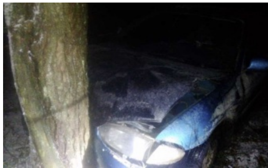
W rej. sołecznikiem samochód przemytników zderzył się z drzewem