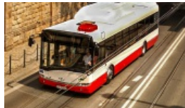
Nowe autobusy w Wilnie