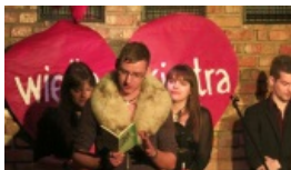
Kameralna „orkiestra” w Sakwie