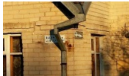
Można wesprzeć osoby karane za dwujęzyczne tablice z nazwami ulic