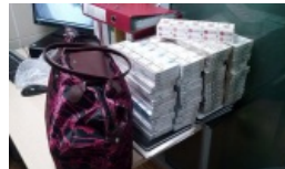
Dwie Białorusinki miały pod ubraniem ponad tysiąc paczek papierosów