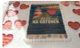
Sztab WOŚP w Wilnie zebrał 8 tys. litów