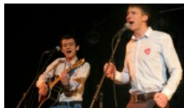
„Dobra okazja, aby przekazać swoją miłość potrzebującym”