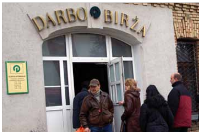
Fundacja zachęca do zgłaszania informacji o anonsach o pracę, które mogą zawierać treści dyskryminacyjne

Ustawa RL o równym traktowaniu (LR Lygių galimybių įstatymas) przewiduje, że pracodawca, wdrażając zasadę równych szans, niezależnie od płci, rasy, narodowości, języka, pochodzenia, statusu społecznego, religii, przekonań lub poglądów, wieku, orientacji seksualnej, niepełnosprawności, pochodzenia etnicznego, religii, musi podjąć kroki w celu zapewnienia, by pracownik lub