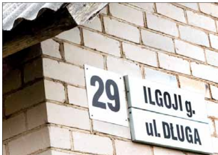
Problem dwujęzyczności nazw ulic wciąż jest otwarty

Krytyka Komitetu dotyczyła ogólnego podejścia Rządu litewskiego do spraw mniejszości. W istocie, na Litwie nie ma żadnych spójnych i wyraźnych przepisów prawnych dotyczących ochrony mniejszości narodowych, a Ustawa o Mniejszościach Narodowych na Litwie nadal nie jest wdrażana (należy przypomnieć, że wtedy jeszcze obowiązywała ta ustawa). Pewne fundamentalne zasady Konwencji Ramowej związane z używaniem języków mniejszości narodowych w przestrzeni publicznej nie znajdują swojej realizacji na