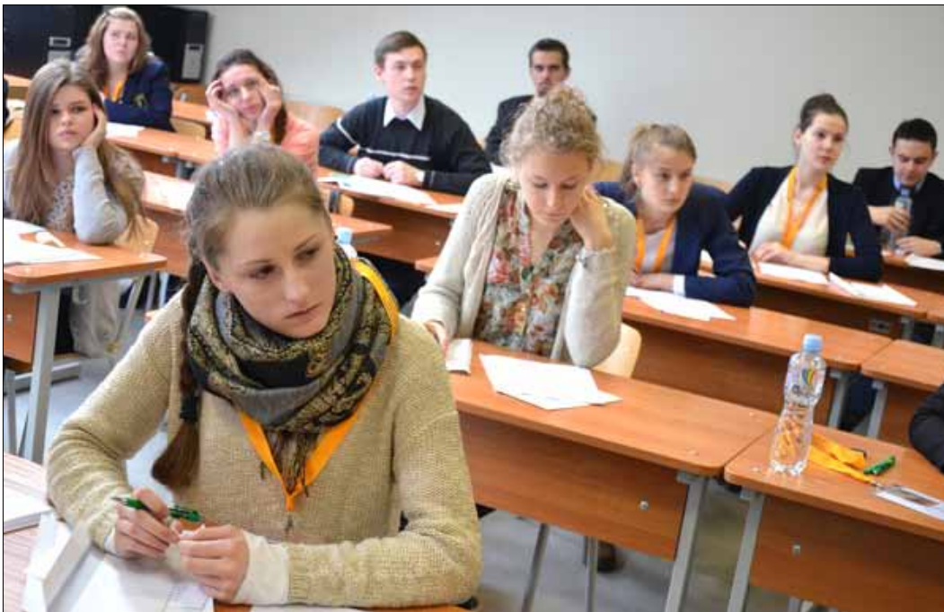
Chwila zadumy przed przystąpieniem do eliminacji pisemnych