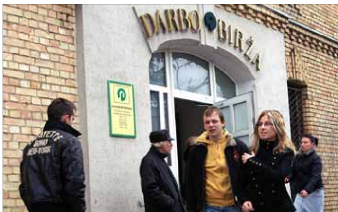
Na Litwie stopa bezrobocia obecnie utrzymuje się na poziomie 11 proc.

osiągnięcia. Rządzący powinni jednak podejmować stanowcze kroki, mające na celu minimalizację zadłużenia. Sposobem na walkę z długiem publicznym jest na przykład prywatyzacja państwowych spółek, zaciąganie pożyczek w bankach krajowych lub zagranicznych oraz monetizacja, czyli dodruk pieniądza.