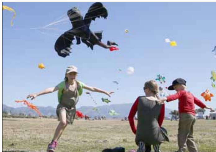
Międzynarodowy Festiwal Latawców w Capetown