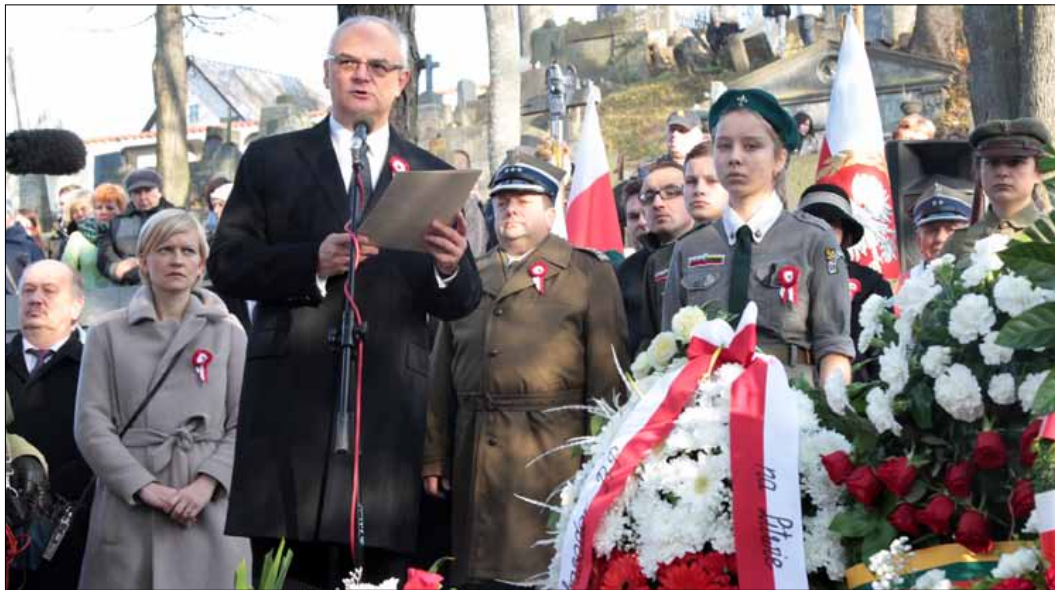
Do zebranych na Rossie przemawiał wczoraj Jarosław Czubiński, ambasador Rzeczypospolitej Polskiej na Litwie

W tym roku przypada 96. rocznica odzyskania przez Polskę niepodległości. Wczoraj, 11 listopada, na wileńskiej Starej Rossie, przy Mauzoleum Marszałka Józefa Piłsudskiego odbyły się uroczystości poświęcone tej dacie. Przedstawiciele polskiej placówki dyplomatyczno-konsular-