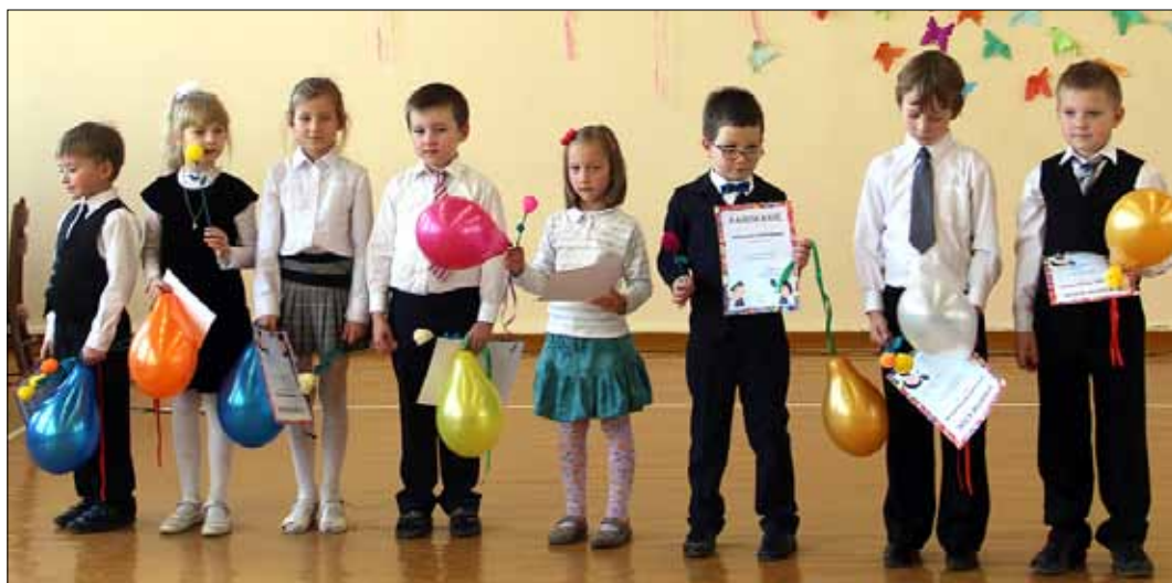
Pierwszoklasiści tańczyli, śpiewali, pokazali, że potrafią ładnie recytować wiersz

Pierwszoklasiści tańczyli, śpiewali, pokazali, że potrafią ładnie recytować wiersze