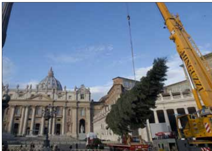
Do Watykanu dostarczona bożonarodzeniową choinkę