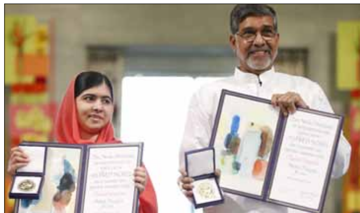
W Oslo wręczono Pokojową Nagrodę Nobla. Tegoroczni laureaci: Malala Yousafzai z Pakistanu i Kailash Satyarthi z Indii