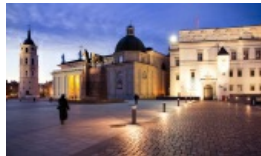
W Pałacu Władców wykłady poświęcone zabytkom historycznym Wilna