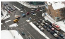
Dziś w Wilnie zawiążyły syreny