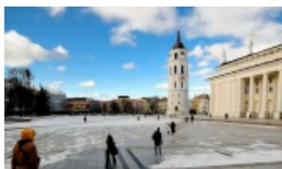
Obchody 25-lecia zwrócenia Katedry wiernym