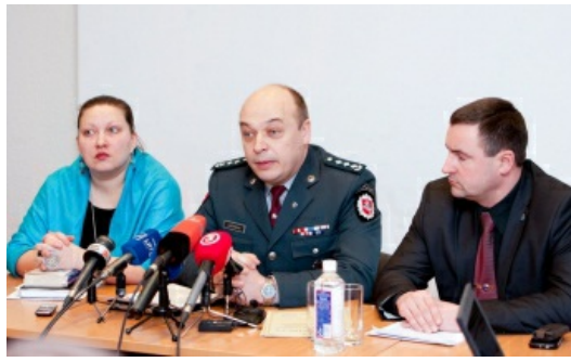
W ubiegłym roku w okręgu wileńskim popełniono ponad 24 tys. przestępstw