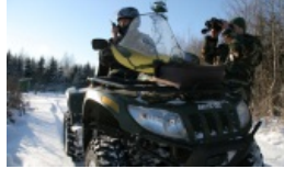
W rejonie sołecznickim zatrzymano Gruzinów