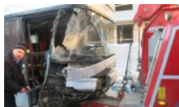
W Wilnie kierowca autobusu zmarł za kierownicą