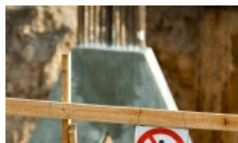
Wilnianie są najbardziej niezadowoleni z dróg