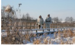
Za spacer przy granicy 600 litów kary