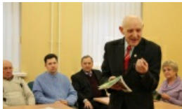
„Ludzie przyszli i mogli wypowiedzieć swoje zdanie”. Prezentacja książki o powstaniu OSSKPL