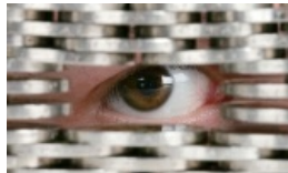
EFHR wywalczyła rekompensatę w wysokości ponad 30 tys. litów