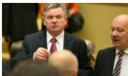
J. Narkiewicz: Cierpliwość mniejszości narodowych jest już na wyczerpaniu