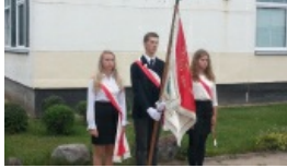
„Mamy bogaty program”. Olimpiada Literatury i Języka Polskiego na Litwie