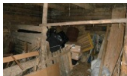
Pijany gospodarz nie mógł wytłumaczyć skąd miał 16 tys. białoruskich papierosów