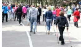
W lutym w Wilnie bezpłatne lekcje nordic walking