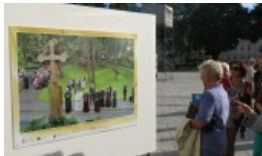
Obchody kanonizacji JPPI w szkołach rejonu wileńskiego