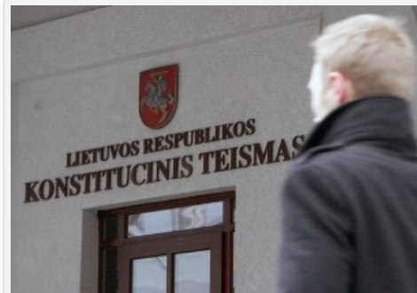
SK wysłuchał argumentów stron sporu między Ministerstwem Sprawiedliwości i Komisją Języka Litewskiego

języka państwowego, jednak tam, inaczej niż na Litwie, reglamentację pisowni nazwisk nie traktuje się jako łamanie ustawy zasadniczej.