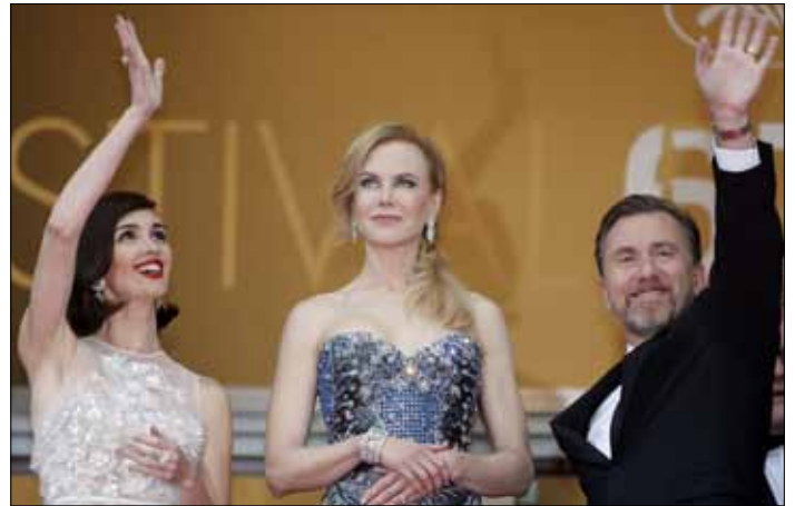
We Francji trwa festiwal filmowy w Cannes