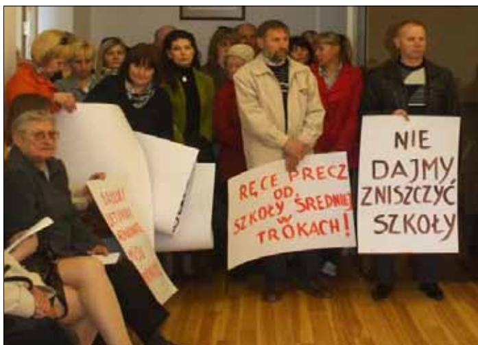
Rodzice i nauczyciele Szkoły Średniej w Trokach na posiedzeniu Rady samorządu