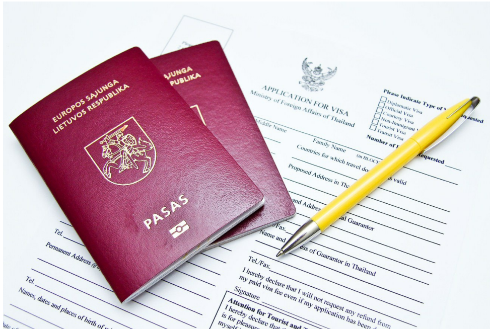
Lietuviškas pasas