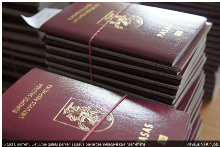
8 tūkst. asmenų Lietuvoje galėtų perkelti į pasus pavardes nelietuviškais rašmenimis