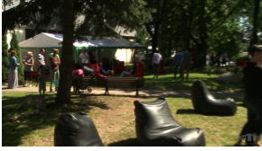
2014-07-11 „Penkių kontinentų“ naujienos Loftų mieste – bendruomenės šventė