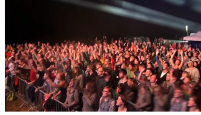
2014-04-29 Lietuvoje Vakarėliai be pagirių – sveika mada