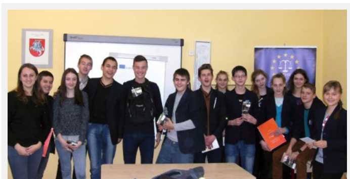
Podczas warsztatów uczniowie zapoznali się z podstawowymi prawami człowieka, międzynarodowymi przepisami

Europejska Fundacja Praw Człowieka (EFHR) informuje o przeprowadzonych w dniach od 26 listopada do 3 grudnia 2014 r. warsztatach na temat międzynarodowej ochrony praw człowieka w 5 szkołach miasta Wilna i rejonu wileńskiego. Ostatni cykl szkoleń w szkołach mieliśmy we wrześniu br. — wtedy przeprowadziliśmy 15 szkoleń dla ponad 500 uczniów.