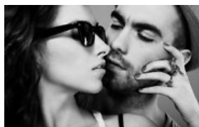
Tobula moteris pagal vyro Zodiako ženklą (6)