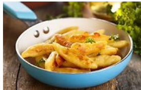
Dzūkiški „šaltanosiai“ (2)