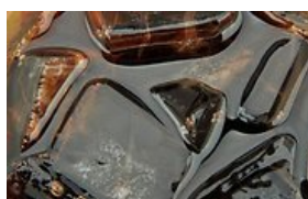
25 praktiški būdai, kaip panaudoti kolas gėrimą