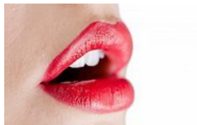
Šlapias NEpasitenkinimas: dažniausios oralinio sekso klaidos (7)