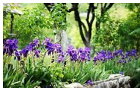
Gudrybės, dėl kurių gėlynas visuomet atrodys išpuoselėtas