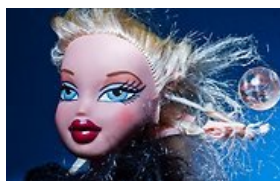
Mama nuvalė keksišką lėlės makiažą ir padarė tokią lėlę, kurios nėra gėda duoti vaikui (FOTO) (36)