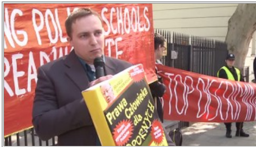
Pikieta w Warszawie w obronie polskich szkół na Litwie