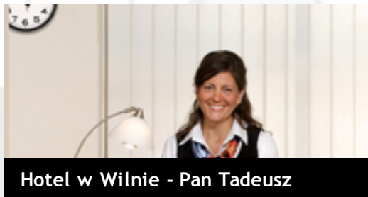
Hotel w Wilnie - Pan Tadeusz