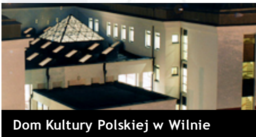
Dom Kultury Polskiej w Wilnie