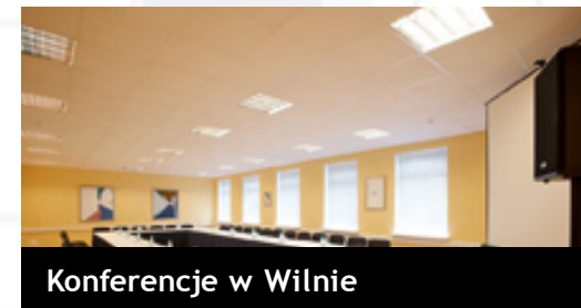
Konferencje w Wilnie