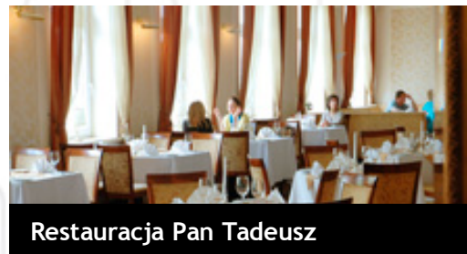
Restauracja Pan Tadeusz