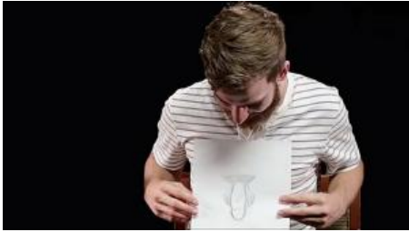
Atkūrė vyriško pasididžiavimo vaizdą pagal moters pasakojimą