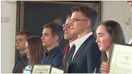
Geriausi moksleiviai lieka Lietuvoje