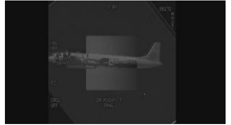
Norvegai parodė, kaip atrodo oro policijos misija virš Lietuvos