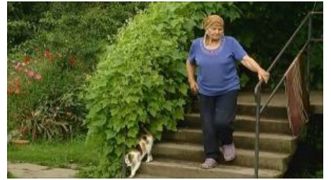
Gąsdinantys skaičiai: Lietuvos kaimas nyksta akyse