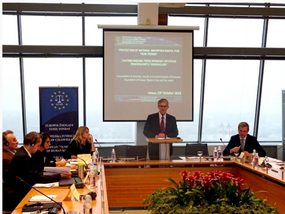
Konferencja prowadzona była w języku angielskim oraz litewskim i poświęcona została przeglądowi mechanizmów ochrony praw mniejszości narodowych na Litwie, oraz w Europie i osiągnięciom EFHR w ciągu ostatnich pięciu lat