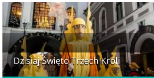
Dzisiaj Święto Trzech Króli