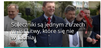
Sołeczники są jednym z trzech miast Litwy, które się nie wyludnia