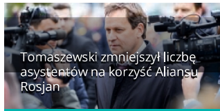
Tomaszewski zmniejszył liczbę asystentów na korzyść Aliansu Rosjan