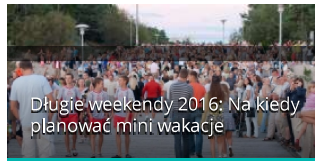
Długie weekendy 2016: Na kiedy planować mini wakacje