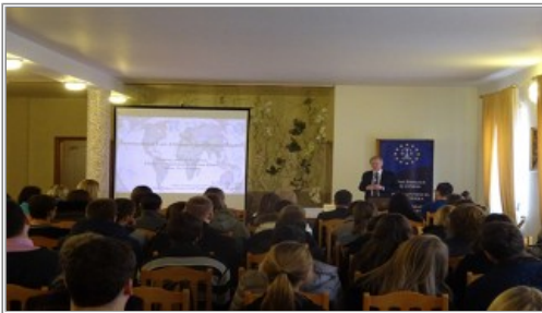
Podczas szkoleń w siedzibie EFHR, fot. efhr.eu

Europejska Fundacja Praw Człowieka, 3 grudnia 2015, 15:12