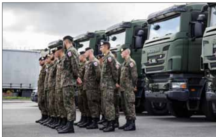
Batalion NATO stacjonujący na Litwie został wczoraj wzmocniony przez żołnierzy Luksemburgu