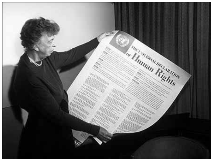
Powszechną deklaracją praw człowieka została przyjęta 10 grudnia 1948 roku

Taka właśnie była geneza Karty Narodów Zjednoczonych – umowy międzynarodowej powołującej do życia Organizację Narodów Zjednoczonych i określającej wartości, na jakich opierać się ma nowa, uniwersalna organizacja międzynarodowa. Dokument ten zakłada cel umacniania przestrzegania praw człowieka na całym świecie. Z kolei Powszechna Deklaracja Praw Człowieka, przyjęta przez Zgromadzenie Ogólne ONZ 10 grudnia 1948 roku, stanowi pierwszy na świecie dokument o zasięgu