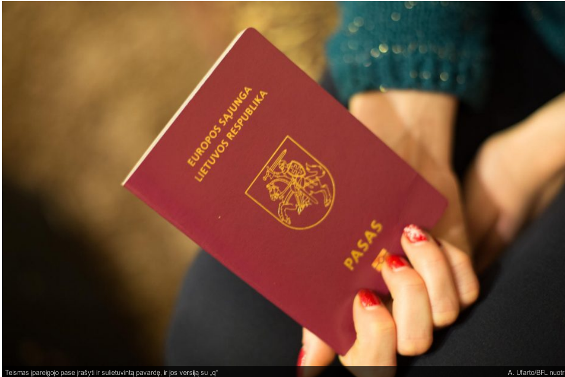
Teismas įpareigojo pase įrašyti ir sulietuvintą pavardę, ir jos versiją su „q“