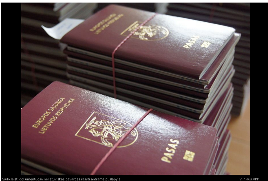
Siūlo leisti dokumentuose nelietuviškas pavardes rašyti antrame puslapyje