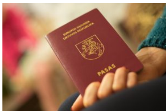
Teisme - bylos ne tik dėl pavardžių, bet ir dėl vardų 1