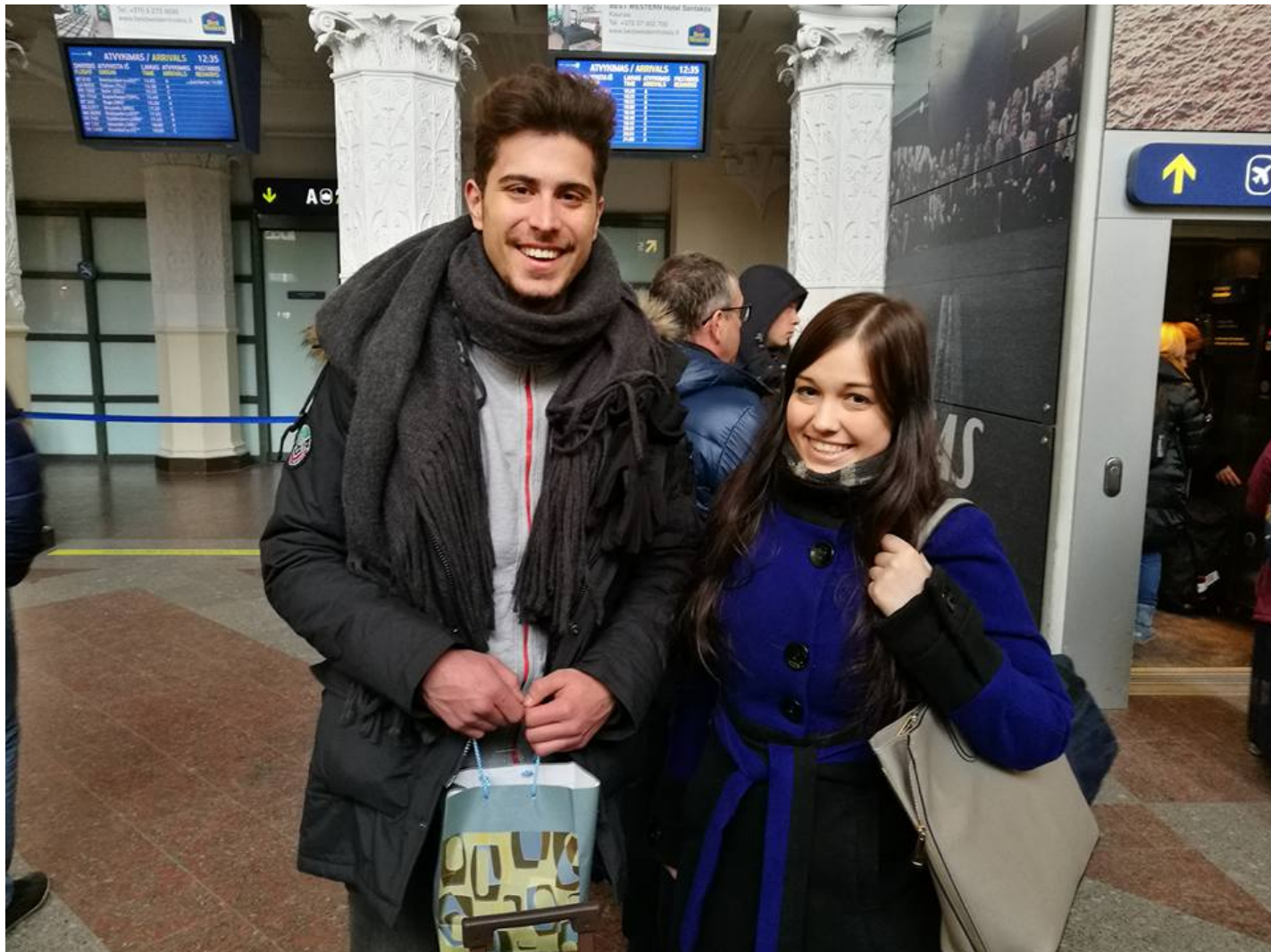
becas erasmus en lituania

La Fundación Europea de Derechos Humanos (EFHR) ha estado implementando y coordinando los proyectos de SVE y becas Erasmus en Lituania otras organizaciones durante varios años. Hacemos todo lo posible para que los voluntarios se sientan como en casa. Estamos muy contentos de poder compartir la experiencia de nuestros socios – la Escuela Especial Šilas en Vilnius.