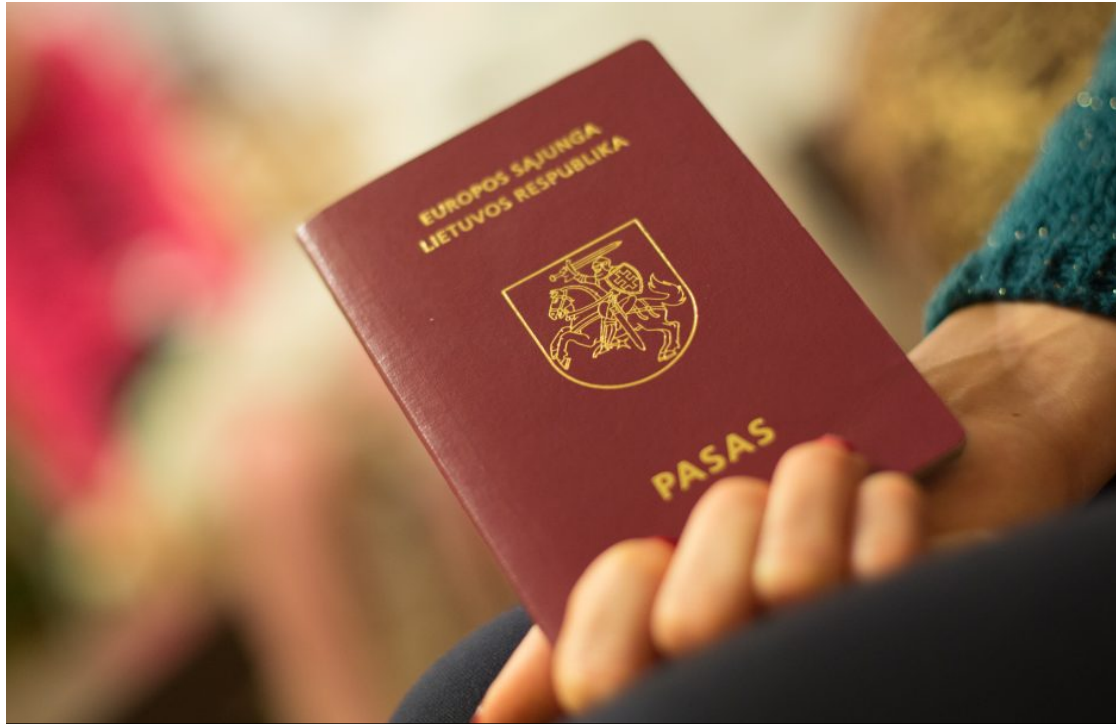
Teisme – bylos ne tik dėl pavardžių, bet ir dėl vardų