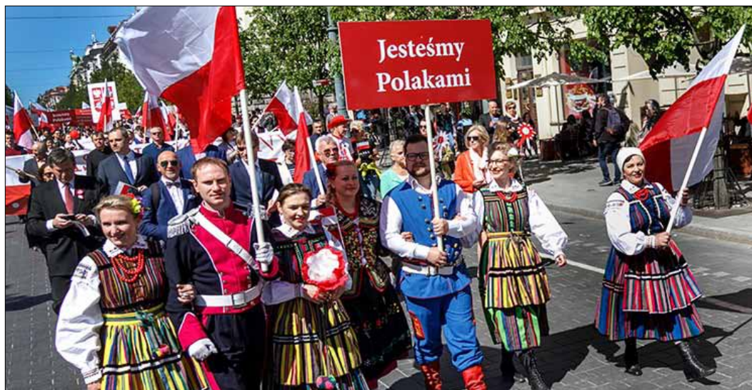
Komitet Ministrów zaleca zwalczanie stereotypów wobec osób należących do mniejszości narodowych zarówno w dyskursie politycznym, jak i w całym społeczeństwie